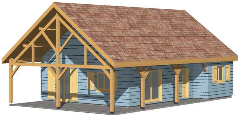
Construction Ossature bois bardage Massif 42

KIT TTC : 60 431 € MONTAGE TTC : 20 144 € TOTAL TTC : 80 575 €